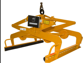
Løftetang type 801

Al målangivelse er i mm og al vægt er angivet i kg.